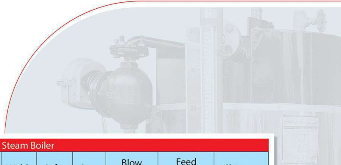
Technical Table Vertical Steam Boiler